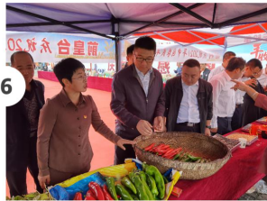
镇领导班子成员参观展品