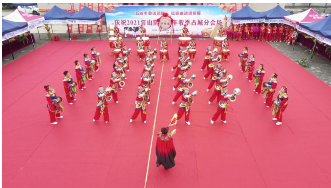
威风锣鼓敲响了丰收的喜悦

歌舞《丰收秧歌》、独唱《不忘初心》、广场舞《家有爸妈》、二人台《五月散花》等节目精彩纷呈，热情的表演也感染了在场的观众，整个古城会场红飞翠舞，热火朝天，一片热闹欢快的景象。