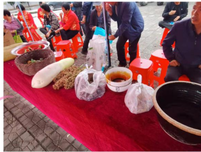
农副食品目不暇接